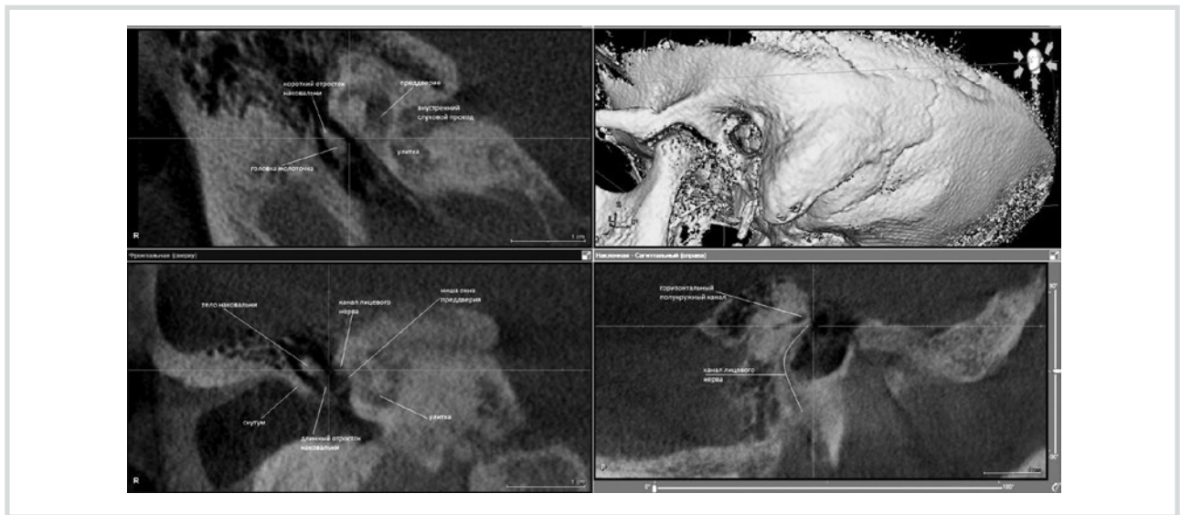
Рис. 2. Больная Ж., 45 лет. КАКТ височных костей. MPR/рентгенологическое исследование.

В сагиттальной плоскости обозначен ход канала лицевого нерва, во фронтальной — расположение канала лицевого нерва над нишей преддверия.